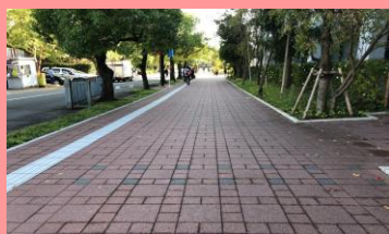
②道なりにまっすぐ進みます