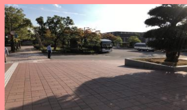
③最初の角を右に曲がります