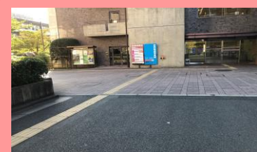
⑨つきあたりを左に曲がります