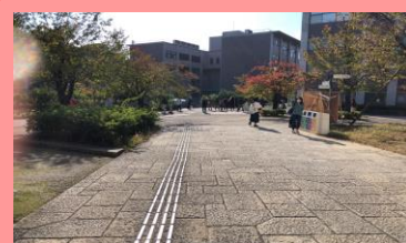
⑥トンネルをくぐってまっすぐ 進みます