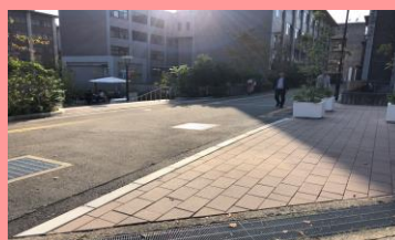
⑦つきあたり(ぼいところ)で 右に曲がる