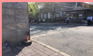
①バス停「立命館大学前」降りて すぐの正門から入ります