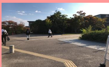
④すぐ左に曲がってバス停の方に 進みます