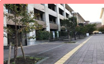
⑪道なりにまっすぐ進みます