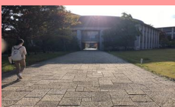
⑤トンネルぼい方へまっすぐ 進みます