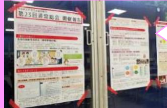
奈良県立大学生協 総会の決定事項や討論のまとめを食堂やTwitterで組合員に公開しました