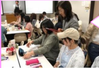
東京BK 跡見学園女子生協 総代会で店舗の文具棚づくりを一緒に考えました