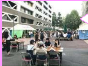
東京BK 横浜市立大学生協 7月に行った取り組みは毎週昼休みの総代ミーティングの中で企画をしました