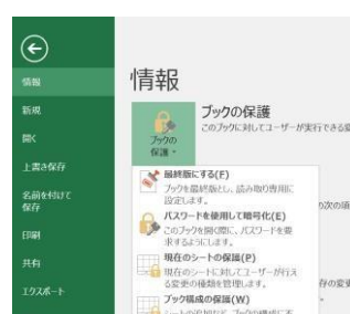
②「情報」から「ブックの保護」をクリック