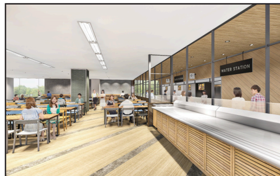
かさねの完成予想図