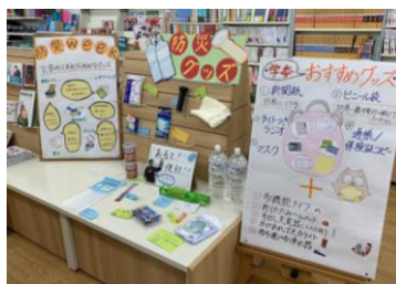
↑購買で防災グッズを展示！注文用紙も用意しました。

【内容】非常食の試食会、防災グッズ展示＆販売、クイズ、SNSで防災に関する動画投稿