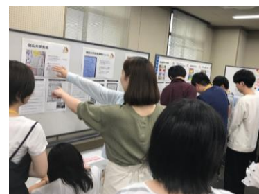
▲北陸エリア夏の共済セミナーでの様子

新入学生委員と一緒に作った共済ボードを対象に、共済ボードコンテストを行いました。