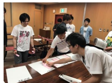
▲京滋・奈良エリア共済推進委員会の様子

応募期間 2019年 5月27日～6月25日 応募数 神戸市外大・関学・滋科大・奈教・京府大・龍谷深草・富山 → 7 学生委員会の応募がありました!