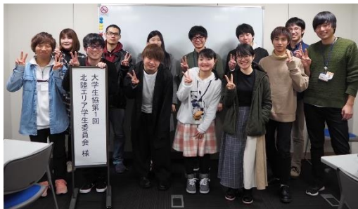
写真は # 1 のものです