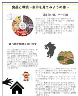
▲作成者：同志社大学 水内さん