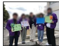
▲新学期の活動(左:滋賀大大津・右:奈良教)