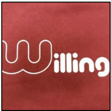
▲滋賀大大津生協学生委員会Willingロゴ