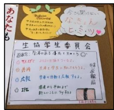
▲奈良教育大学生協学生委員会紹介