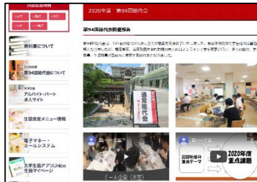
↑ 生協HP上で開催報告もされていました！ 当日の提案の動画なども共有されていたのは オンラインならではのいいですね！