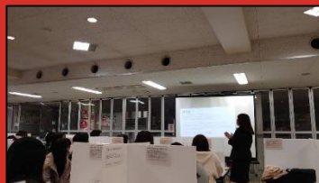
▲京教大の出前講座の様子

高校生向けの消費者問題啓発動画は遂に完成しました！出演や会議などでタスクチームのメンバーが頑張ってくれました。