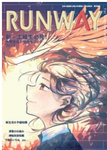
先輩にオンライン授業聞いてみた！